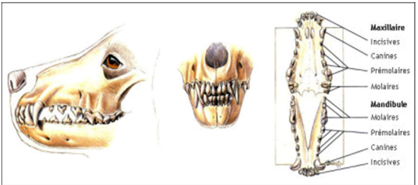
↳ Doc 1 : Dessins du crâne et des mâchoires du chien